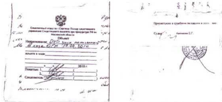
Рис. 4-5. Внешний вид конверта № 2

Поняты: 1. 2. Следователь (подписи)», «Просмотрено в судебном заседании и опечатано судьей Аминова Е.Г.» (рис. 5-6). На конверте имеется три оттиска круглых печатей разного размера с неразборчивым текстом синего цвета, один из них перечеркнут (рис. 2-3).