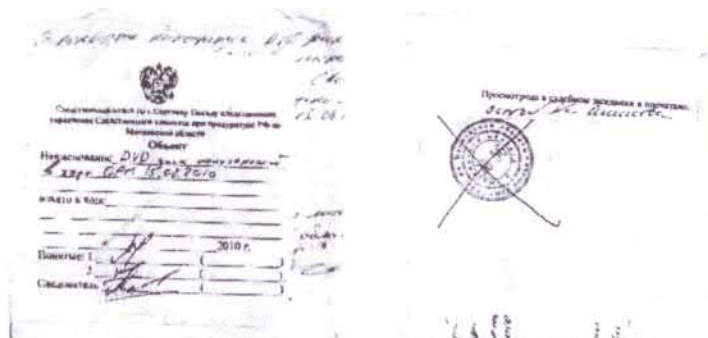
Рис. 2-3. Внешний вид конверта № 1

После вскрытия конверта в нем были обнаружены два самодельных белых бумажных конверта, оклеенных скотчем, на которых имеется неразборчивый текст, выполненный рукописным шрифтом синего цвета.