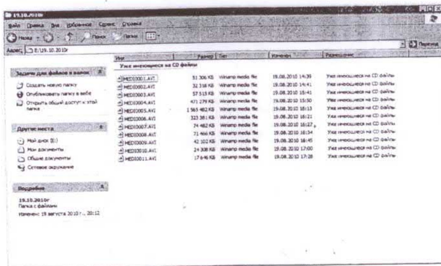
Рис. 9. Содержимое диска 2

видео – AVI. Файлы представляют собой видеозаписи, содержащие, согласно постановлению, съемку ОРМ, происходивших 19.08.2010.