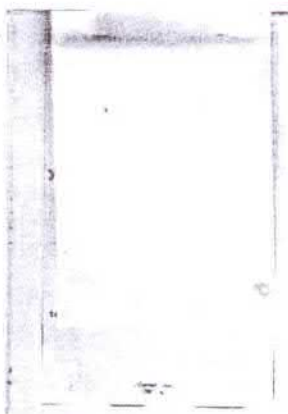
Рис. 1. Внешний вид упаковки

Объекты поступили упакованными в белый бумажный конверт, прикрепленный к тому № 11 уголовного дела № 1-482/15. На конверте имеется надпись, выполненная рукописным шрифтом серого цвета следующего содержания: «Диски 2 шт.» (рис. 1).